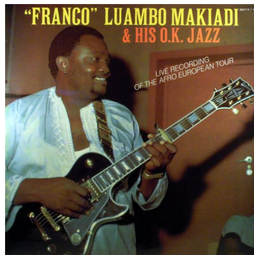
Franco Luambo Makiadi